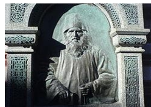
Надгробната плоча на Неофит Рилски в Рилския манастир

Рилски, един от най-големите просветители по време на Възраждането, почива на 4. януари 1881 г. в Рилския манастир.