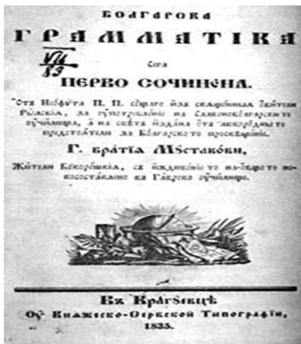
"Болгарска граматика" (Крагуевац, 1835) от йеромонах Неофит Рилски

След две години учителстване в Копривщица Неофит се прибира в манастира, и продължава книжовната си дейност. След като получава покана да преподава славянски езици в богословското училище на Халки, той преподава там от 1848 до 1852 година, след което се връща в Рилския манастир, поради върлуващата в училището холера. През 1851 г. излиза неговата „Аритметика“, а година по-късно - „Христоматия славянского языка“. От 1852 година до края на живота си се посвещава на книжовна дейност в Рилската обител.