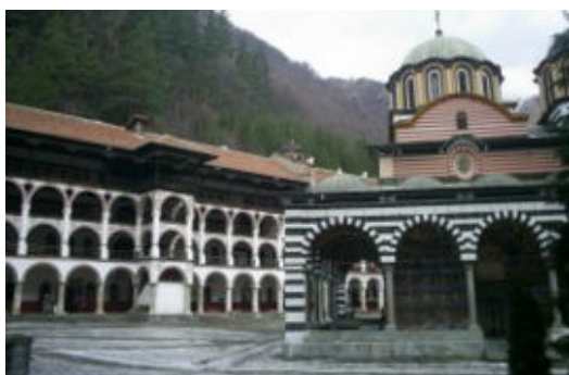
Рилската света обител

4. януари 1881 г. - йеромонах Неофит умира в Рилския манастир.