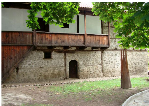
Родната къща на Неофит Рилски

Никола Поппетров Бенин - бъдещият Неофит Рилски (1793-1881), е роден в град Банско - на 60 километра южно от Благоевград, разположен в полите на Пирин планина. Баща му поп Петър, произлиза от рода на Бениновци, а майка му Екатерина, от род, който е принадлежал към заможна разложка буржоазия през 18 и началото на 19 век, и която е въртяла голяма търговия с памук от Драмско и Сярско със Сърбия и Австрия. Всъщност кариерата на бележития български възрожденски деец тръгва от килийното училище на баща му в Банско и преминава през Рилския манастир.. Тук той пристига през 1811 г., за да учи живопис при основоположника на Банската живописна школа Тома Вишанов - Молера. Вместо художник обаче става монах, приемайки името Неофит, след което учи в Мелник, където получава завидно за времето си образование.